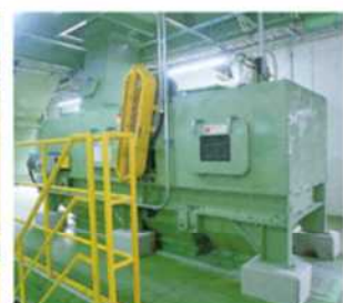
■破砕アルミ選別機